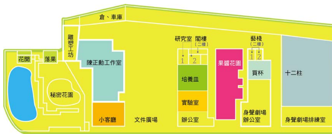
竹園工作室平面圖