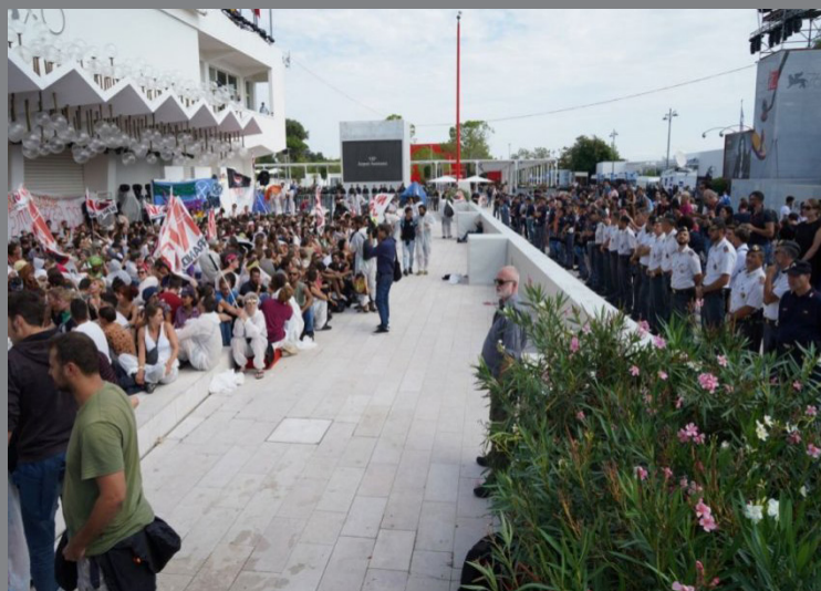
2019.09.07 威尼斯氣候陣營（ Venice Climate Camp ）佔領威尼斯雙年展電影節紅毯