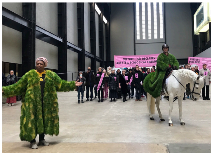
社會運動社群 Culture Declares Emergency 在倫敦泰特現代藝術館藝術佔領 圖片由視覺藝術家組合 Ackroyd & Harvey 提供