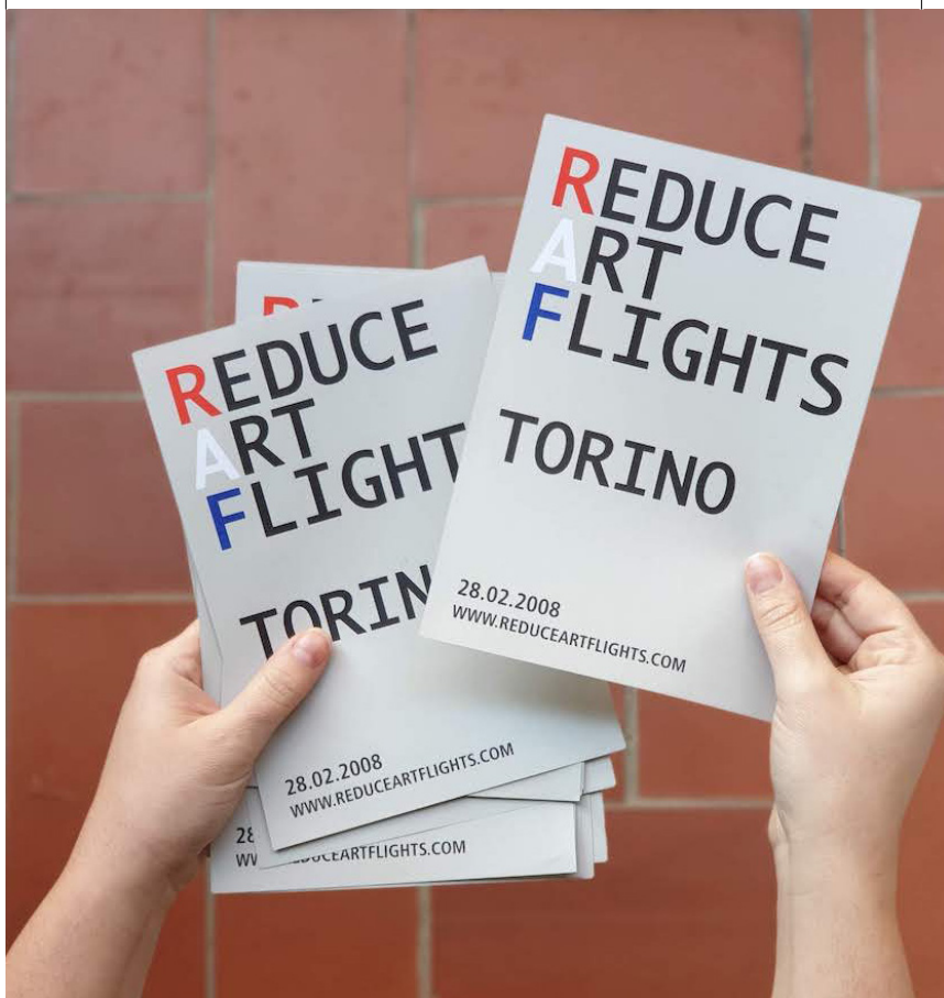
「減少藝術飛行」運動